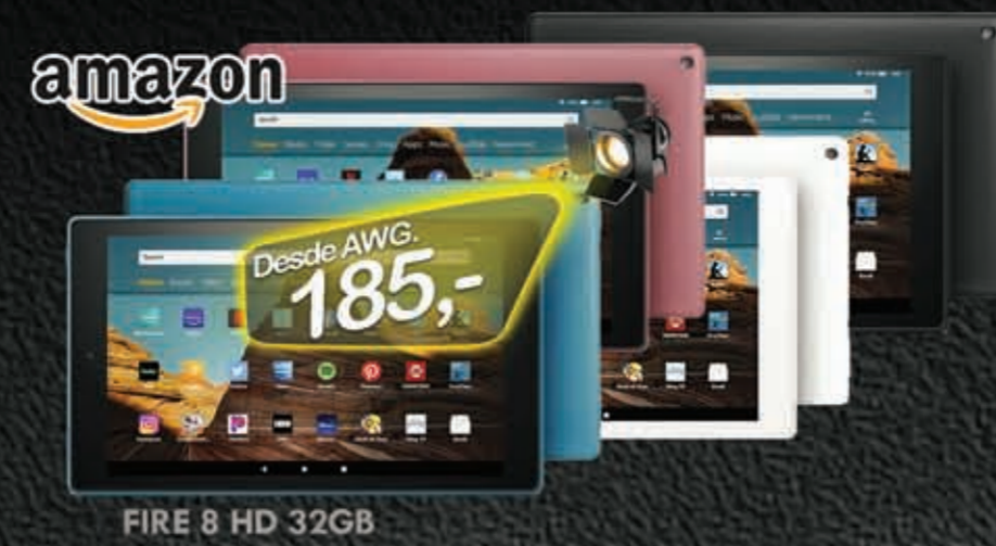
FIRE 8 HD 32GB